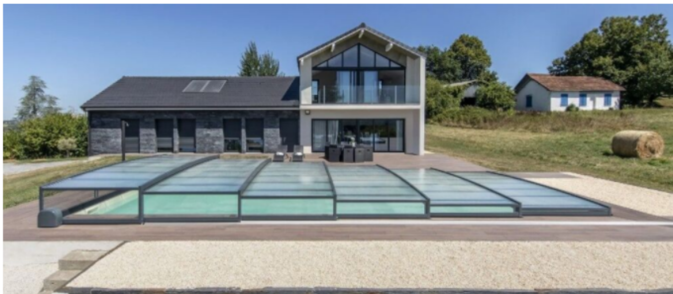
Abri de piscine ultra-bas Lucio, par Abridéal

En cette année 2021, Abridéal , acteur majeur de l'abri de piscine en France, connaît un essor de son activité ! Entre projets à l'international, augmentation du chiffre d'affaires et du nombre d'installations d'abris de piscine, la société est en pleine croissance ! Et pour accompagner cette expansion, Abridéal inaugure une nouvelle usine de production , située à Angresse, dans les Landes, à quelques mètres du site de production historique de l'enseigne.