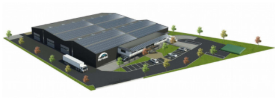
Les plans 3D avant la réalisation de l'usine Abridéal

Lors de la célébration de ses 40 ans, en 2019, Abridéal décidait de la construction d'une nouvelle usine de fabrication d'abris, pour accompagner une croissance sans précédent. Après l'ouverture d'une 6e base logistique en France en 2020, c'est donc un nouveau cap que s'apprête à franchir en cette fin d'année 2021 le précurseur de l'abri de piscine amovible.