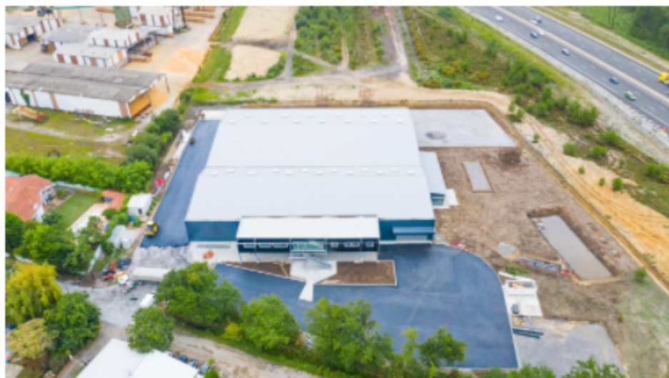
La nouvelle usine d'Angresse (40) inaugurée en septembre 2021

Dès 2022, Abridéal aura la capacité de produire près de 5 000 abris piscine chaque année sur le site landais.