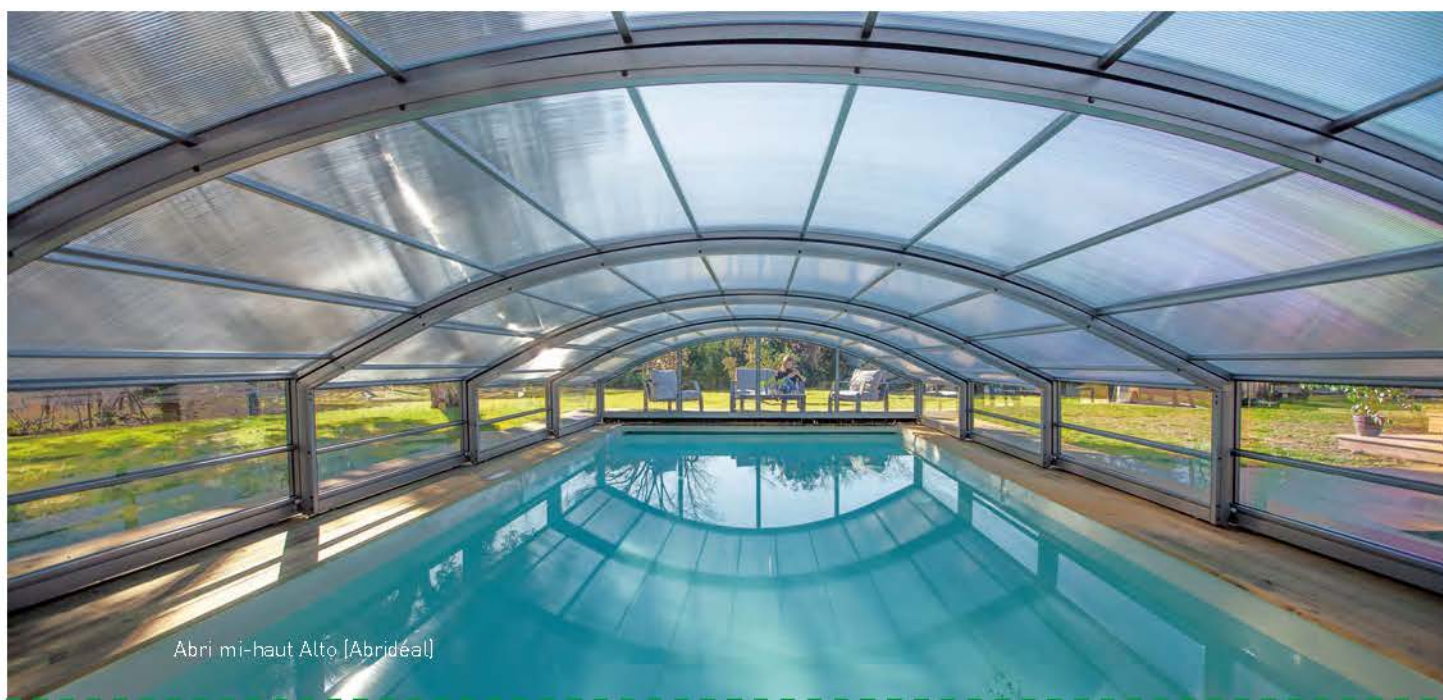
Abri mi-haut Alto [Abridéal]

Ils reprennent les avantages des deux précédents types d'abris. La montée en température y est rapide, le phénomène de condensation limité et l'on y profite de volumes suffisants pour la baignade et la détente sur les abords. Quant à leur taille et leur volume, ils permettent de ne pas trop impacter l'équilibre paysager.