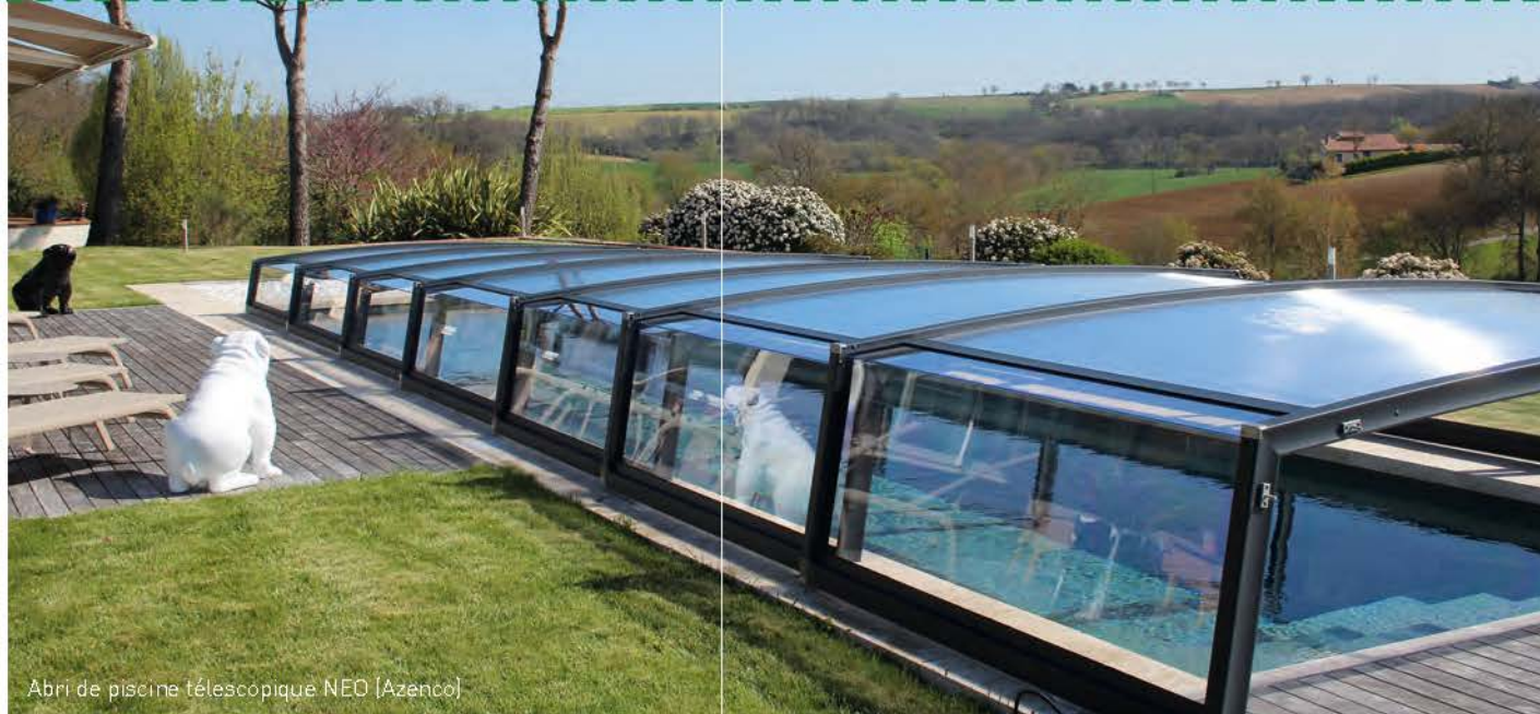
Abri de piscine télescopique NED [Azenco]