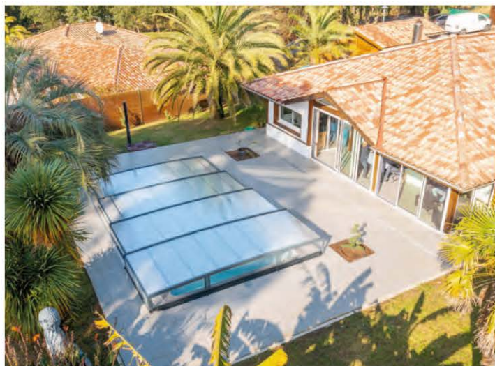
Abri Lucio (Abridéal)

Recouvrir sa piscine d'une couverture ou d'un abri combine deux avantages en un équipement : sécurité et confort. Du chauffage naturel à la protection de votre bassin en passant par la gestion automatisée, l'installation de l'un de ces deux systèmes est la garantie d'une tranquillité et d'un bien-être de baignade inégalés.