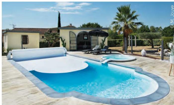
Volet Open Solar (Abridblue)

L'ouverture et la fermeture de l'abri comme de la couverture peuvent être motorisées. Dans ce type de configuration, la manipulation manuelle est toujours possible comme l'exige la loi. L'automatisation est donc un plus pour le confort de l'utilisateur. À clé ou à télécommande, l'équipement se déploie et se replie au gré de l'usage du bassin.